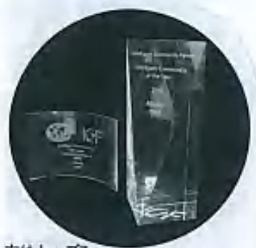
左はトップ7、 右はトップ1のトロフィー

WTA（世界テレレポート連合）とは、情報通信や経済の効率化を推進するために1985年に設立された国際的な組織で、世界の116の団体、日本からはNTTドコモ、東京都などが参加しています。 この団体は1999年から、世界のITを活用して経済や文化、社会を発展させた優れた地域をインテリジェント・コミュニティとして表彰しています。 三鷹市は1月に2005年におけるトップ7に、さらに今回トップ1に選ばれました。 今回の受賞では、三鷹という地域が、1984年のINS実験以来、常に最先端の技術を取り入れてきた点をはじめとして、「SOHO CITYY みたか構想」「市民プラン21会議」「あすのまち・三鷹推進協議会」「三鷹ネットワーク大学」など、市民や研究機関、企業、行政が「協働」（コラボレーション）によって、まちを